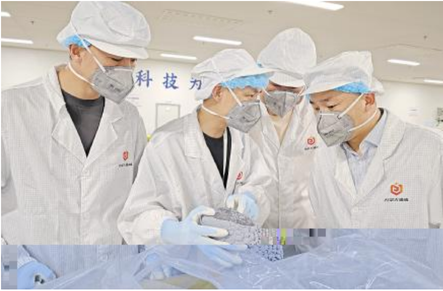
永祥股份品管部赴内蒙古基地质量监督检查现场