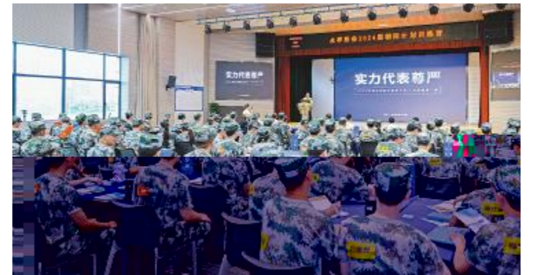
2024届朝阳计划开营仪式现场

思%合心 初心如磐 b F 层| 阶p ' 才培养) 8 H R层 者v 课 航 综 Q/ | . 层 者 P 远航 F 案拟 d +/ } 56 Q/ P ; 航 n 6 培训 314x p K y c朝阳 引 160x k届 / 5 u . 培训师: 徒 > | + 培养, - ; | > K> 突破 5000 B; o五星 p>选 B 红旗班 > p n = 态 _ Q/班 _ P QR p R59 P 严格6 7 6阶p培训 可转 70误操 8