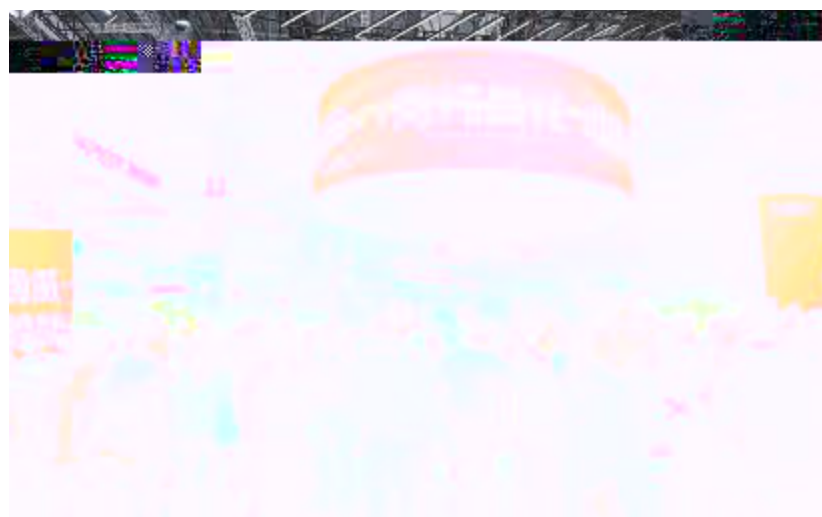
2024SNEC通威展台上,永祥股份高纯晶硅产品获得广泛关注