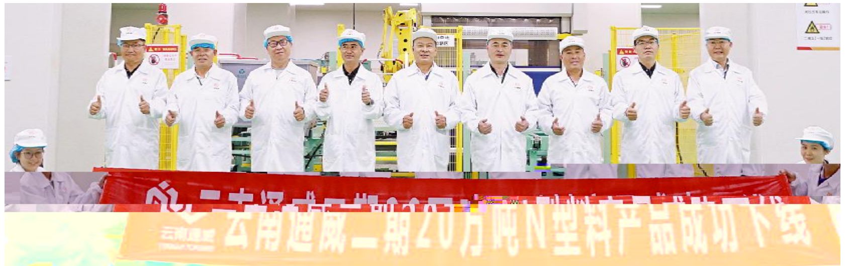
云南通威二期20万吨N型料产品成功下线