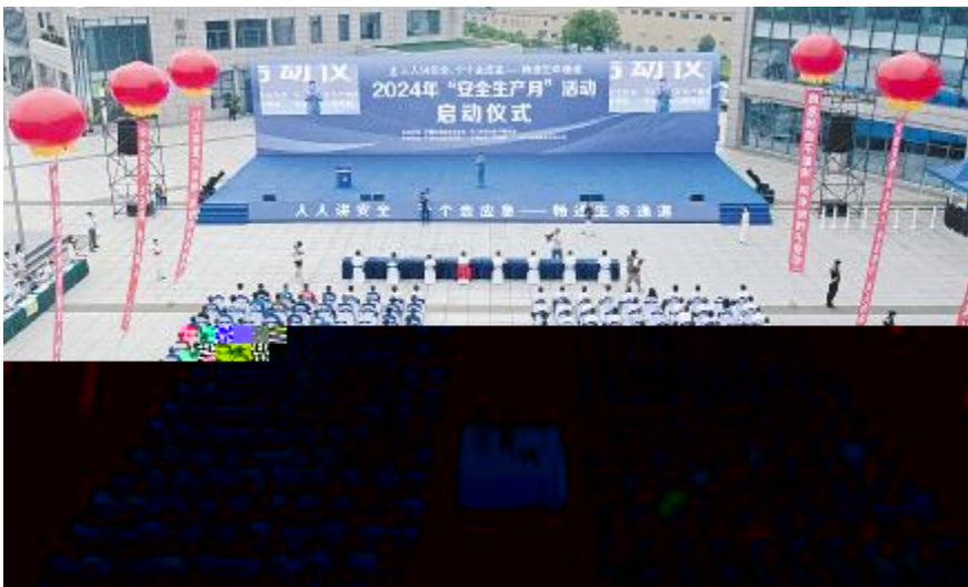
乐山市2024年“安全生产月”活动启动仪式现场

S 7 ] 力 R 量 3 系 [ \ H 级 S 7 TUVWg An XYZ [\ ] 3] Tv ) + ^ _ ` a) b F Tv O c C$de & f & 23 & 3 & TvDE d 8g h 6 i j k 60Tv) @ 1 l m 8 n + g _ b F 56Ny Zopqu 90r stu v\X TU. Tv wxy TUz ' R 97.86%