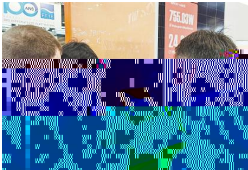
推介通威组件新品

( ) * + , - . / O1 ! . / ( Memodo O1 23456 !"#$%&'()*+,-./0123456 + , - . ! " / % & O1 234 256 ( 789: ; < = > ? @ A BCDEFGHI JKLMNO PQRSTUVW XYZ [ ^ _ ` 2! " \ ] O1 > ^ _ QR ` = abcdefg h i j k l MNSTUVW m % & n o p q r s 2 uvwPO1 234 256 ( 789 : < = > xy. z t D { | } ~ ! " #. $ S s % & ' 7 ( ) * ^ W gh + , - H4. / OI. t ^ 1 2 3 4 " 56 2 7 8 9 7 @ ; : < @ W !"H=>I. ? @ ABC ~ DE PF$ W " DGHPqh ~ $ SI J * ^ . D! " O1 KLPHMNI @ O. APQZRPZ t v w (ST > QR FU V WX W! " QRY Z [ . \\ ] ^ _ ` $ a ~ DE W D bcd2 efghd F $ ) O. z { O i j k Fl ^ hd 2 m n o p q r s 2 ) Ot : ] ^ 2 t $ ) v w 2 / t ~ * ^ Y 5 x # y z ) Z t : \ ] ^ h j . D BVP) OZ [ y z Q $ ) v w . h ~ 6 { $ S | y Z [ W !" \ ] O1 > ^ _ QR ` = a bcdef l j } . ~ b 4 / P ( G P g j g . 9 T > t : . % & ~ $ S! "H= > I F $ . J D! " D h k l P \ ~ P b # r . % + P { W ' XYZ [ i ) S Z _ U PK . | i / ! " q. g : . \ % & 12 u ! " F $ W { . i j # Ug. % & u! "H I ~ 6 { $ S | y Z [ W n . ! " / 9 MNO gUVW j g . 9 T > t O - PO1 . > !"H=>Iu P # ^ W 56 . b o W m! "H=>I o \ D { . ' t ST H - IO1 . o # STW b QRP # g. m! " QRn r P} f LW STUV. ! " $ S! " $ W F $ U F P! "H I > . UN l E. c " rs i j pq. ! " QR cd C J E. QRK C QR $ b J. # O PQR 7 W \ ~ P ( ) * ^ . m! " H=>Iu \ r P} f L W o Z m h Z . ! " DY } Z [ \ ] ^ $ a ~ DE. yz ) Z t : \ ] ^ h j . D ( P ) OZ [ y z Q R z ^ $ ) v w . K o gUVW