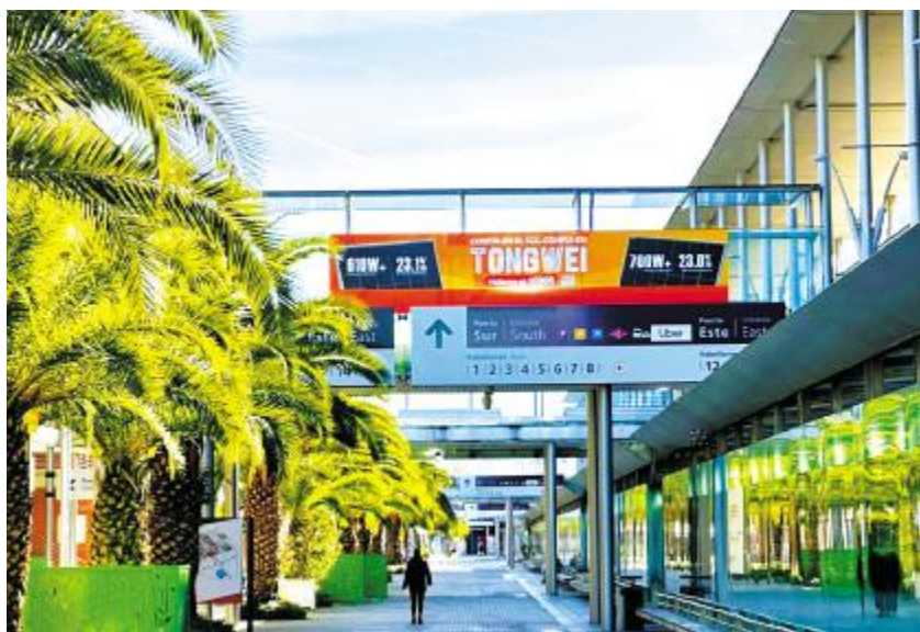
通威“智造”亮相西班牙马德里各大主要交通枢纽

AB2 4. AB P + O1 KL )6W !" ZSb QR. @ 4. A B ' 5 O1 6( `h T>H y IO1K $S} f @. m P4. S t: W m H i k 4. 7 o } . m Pb } O1 W Pb o % b2 f <* 2 W . O1 j . n Q . <*q %2 /! 6 " # $ &1A6' q &1(u' n . m ) * b % 2@ +, ] <. gt m W - . H/O IOL Z 1) . O1) 6/2/t34 . yzH ) 6E 2/IPOL. 4 5 . 067 . . yz8 DE9p. y2 2 Ft; <= W b O . b > . o ) 6O > &? @. ! A B OCPo. 6 ODg. Eo cdF B G2H: JK BGW !" L MNOK$ ! " Z[ + @PQO /tBRSt.Ut z TU T2/Wz X3 <j YZ/ M/[P . MNq, | \ ] c^7 . _` mab cdz e YZ+@2 fgW @. h, ! F2, z X32i 2 e j k <j ! ! * ^ A O 4. ABPy?r W l +hm/!" 1 ' A LO1 P g. + O1 cdnoVrh i !" Z Lp ymF$ $q y@W+ !" QR r7s tuK U@; ST.v xw! " x Zyz2 ! 9 5kFK . F45A.STZZ[W : ! " {tc |KD} -h . ! P ] * ^7SIY4" @) " Z# $ % & ' E D( ^ {t$ a ) * + P4 @W ! ! / {t. d , P- 7. DZ[ , cZ P/O&' +@. W 126((q345$ . \_ - . ! ! " 67i 8b QR. K b2) 9.ZsO P: GcZW l ^ !" $; j b l F.Zs DF$+@ T $) ZZ[.h < . $SOZ=S=W gh 4. AB' A L5 O1 . | l bcd.MN\ P, .hdVYZ. D5> 2? #P@hAB. h CD7 ERP#4. RH# GIW @.!" / 4. ABgh H{ 7@{P kl. ij VVI` . h 4. 6@4 (K2 aJ OK6K \ @L&@2 @+ cMb) O) Au#NOW