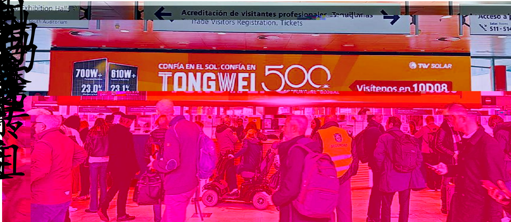
通威“智造”亮相西班牙马德里各大主要交通枢纽