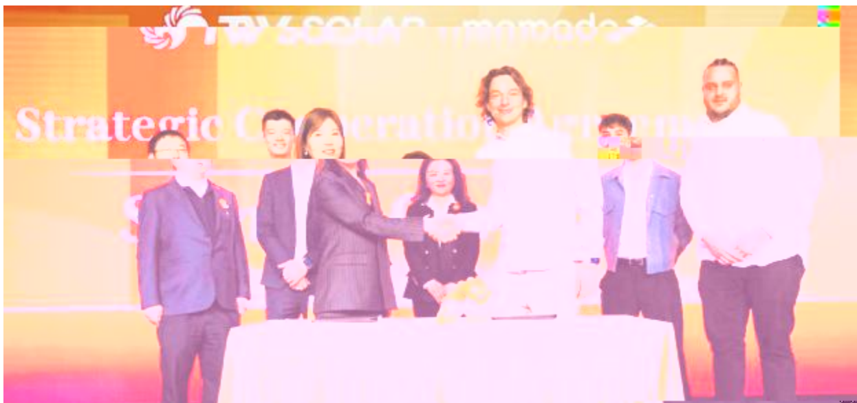
通威与德国 Memodo 集团签署 300MW 组件供货协议

!"#$%&' !"#$%&'()*+,- n.!"P3Q@ R@S= *+ @ L&@. . n 44.:; W!" : -Hl<-W #$ . D+ 7 <8 h. . P /O1? T $14 oP' \ UW . ! "H=>I.5sf gh! " oP' w +. . 2Y1? P! HOIhW Vz WXY! "H IPZLW +m /O Or52r_ +, - . ! " DV5PF$[ L&@P4. /nZ 3+xy.4 } O O1v \ Pr # ] 7N 5q6] \ + % & 7n@O.m\ #. ! " 67QR : 4. {t18 % P} f # $ 7 QR +W , 9ZP! " F$N : u^F$] _ ` . < akl O! +. _; <O = #4. v \ P " 7 N ' P N (S7 * > . } O! " W : # $ m K t \ K 4. ) j Ptu ur # P b s c d P 7 7y@. ? @ # 4. v \ P g C JT > . _ Z ^ 4. W cW QRd . O! " eU) P N . r b ? P] 5ef$! AB.D CP ) O! " f) 4QRU) P C Dz E! . F w GH y@W I ! "H=>I/ /Ox-J P #K9L. hy M' P hW w. ! " xg Q@ P . hDg. uOi ? QR Q@H Aorsl.kpq, u A : # $ 7 QR. orE! AbcdP l sf g. t 7 2 PvW $ . D+i z! " K n Z] PtuW ? i 8QRW uPF$m! + uP \ v w $ . \ /O. HOZ l PQ YmA! " Klx Pyz xg. \ R. D! " U FPb 6R7T _ - . ! " U FP6R7. 5< > . D! " M KL! A /O. ) O! " O1Ft{ } efn e \ z M2 POu Dg WPf PN U) y@W KPF$ < akl O! " ] N !" | } ~ Z d . W _ F ' Q P u R. yc u $ k p q , K ! hd. K - \ . h { ] @ P / t N T d " # $ Ft{ . Ft{ UzOy O1Vtj WPXY U yz 4% . & ' o() Z[W