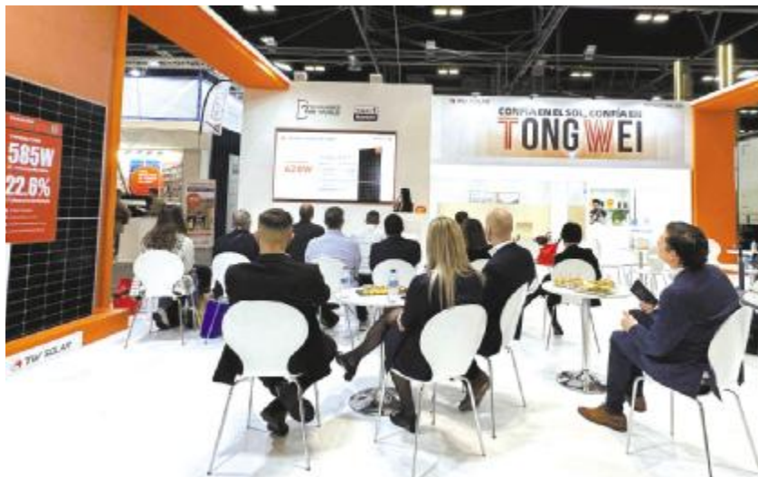
通威产品技术推广会现场

!"#$%&' !"#$%&'()*+,- n.!"P3Q@ R@S= *+ @ L&@. . n 44.:; W!" : -Hl<-W #$ . D+ 7 <8 h. . P /O1? T $14 oP' \ UW . ! "H=>I.5sf gh! " oP' w +. . 2Y1? P! HOIhW Vz WXY! "H IPZLW +m /O Or52r_ +, - . ! " DV5PF$[ L&@P4. /nZ 3+xy.4 } O O1v \ Pr # ] 7N 5q6] \ + % & 7n@O.m\ #. ! " 67QR : 4. {t18 % P} f # $ 7 QR +W , 9ZP! " F$N : u^F$] _ ` . < akl O! +. _; <O = #4. v \ P " 7 N ' P N (S7 * > . } O! " W : # $ m K t \ K 4. ) j Ptu ur # P b s c d P 7 7y@. ? @ # 4. v \ P g C JT > . _ Z ^ 4. W cW QRd . O! " eU) P N . r b ? P] 5ef$! AB.D CP ) O! " f) 4QRU) P C Dz E! . F w GH y@W I ! "H=>I/ /Ox-J P #K9L. hy M' P hW w. ! " xg Q@ P . hDg. uOi ? QR Q@H Aorsl.kpq, u A : # $ 7 QR. orE! AbcdP l sf g. t 7 2 PvW $ . D+i z! " K n Z] PtuW ? i 8QRW uPF$m! + uP \ v w $ . \ /O. HOZ l PQ YmA! " Klx Pyz xg. \ R. D! " U FPb 6R7T _ - . ! " U FP6R7. 5< > . D! " M KL! A /O. ) O! " O1Ft{ } efn e \ z M2 POu Dg WPf PN U) y@W KPF$ < akl O! " ] N !" | } ~ Z d . W _ F ' Q P u R. yc u $ k p q , K ! hd. K - \ . h { ] @ P / t N T d " # $ Ft{ . Ft{ UzOy O1Vtj WPXY U yz 4% . & ' o() Z[W