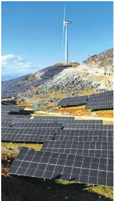
通威保供蜀道会东 200MW 光伏项目

( ) * + , - . / O1 ! . / ( Memodo O1 23456 !"#$%&'()*+,-./0123456 + , - . ! " / % & O1 234 256 ( 789: ; < = > ? @ A BCDEFGHI JKLMNO PQRSTUVW XYZ [ ^ _ ` 2! " \ ] O1 > ^ _ QR ` = abcdefg h i j k l MNSTUVW m % & n o p q r s 2 uvwPO1 234 256 ( 789 : < = > xy. z t D { | } ~ ! " #. $ S s % & ' 7 ( ) * ^ W gh + , - H4. / OI. t ^ 1 2 3 4 " 56 2 7 8 9 7 @ ; : < @ W !"H=>I. ? @ ABC ~ DE PF$ W " DGHPqh ~ $ SI J * ^ . D! " O1 KLPHMNI @ O. APQZRPZ t v w (ST > QR FU V WX W! " QRY Z [ . \\ ] ^ _ ` $ a ~ DE W D bcd2 efghd F $ ) O. z { O i j k Fl ^ hd 2 m n o p q r s 2 ) Ot : ] ^ 2 t $ ) v w 2 / t ~ * ^ Y 5 x # y z ) Z t : \ ] ^ h j . D BVP) OZ [ y z Q $ ) v w . h ~ 6 { $ S | y Z [ W !" \ ] O1 > ^ _ QR ` = a bcdef l j } . ~ b 4 / P ( G P g j g . 9 T > t : . % & ~ $ S! "H= > I F $ . J D! " D h k l P \ ~ P b # r . % + P { W ' XYZ [ i ) S Z _ U PK . | i / ! " q. g : . \ % & 12 u ! " F $ W { . i j # Ug. % & u! "H I ~ 6 { $ S | y Z [ W n . ! " / 9 MNO gUVW j g . 9 T > t O - PO1 . > !"H=>Iu P # ^ W 56 . b o W m! "H=>I o \ D { . ' t ST H - IO1 . o # STW b QRP # g. m! " QRn r P} f LW STUV. ! " $ S! " $ W F $ U F P! "H I > . UN l E. c " rs i j pq. ! " QR cd C J E. QRK C QR $ b J. # O PQR 7 W \ ~ P ( ) * ^ . m! " H=>Iu \ r P} f L W o Z m h Z . ! " DY } Z [ \ ] ^ $ a ~ DE. yz ) Z t : \ ] ^ h j . D ( P ) OZ [ y z Q R z ^ $ ) v w . K o gUVW