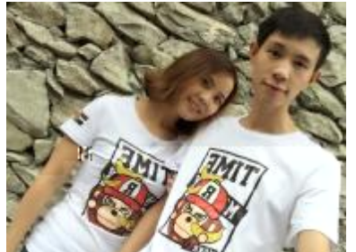
《幸福生活》 /OPQU产部倪天伟