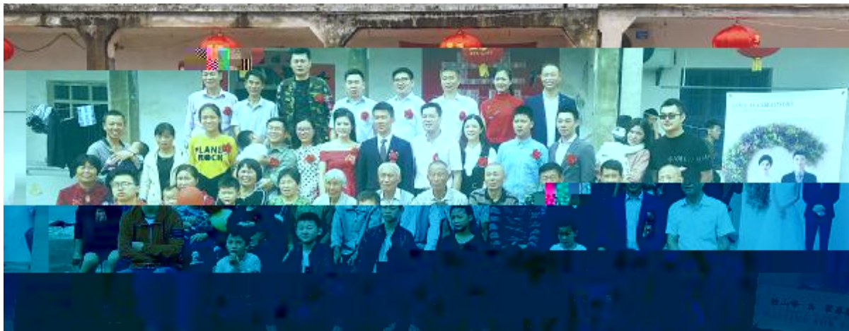
《相 相 》J KPO电池二=U产部陈山峰