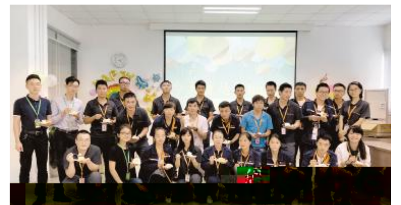
/ OPQ寿星? @XJ 影留念