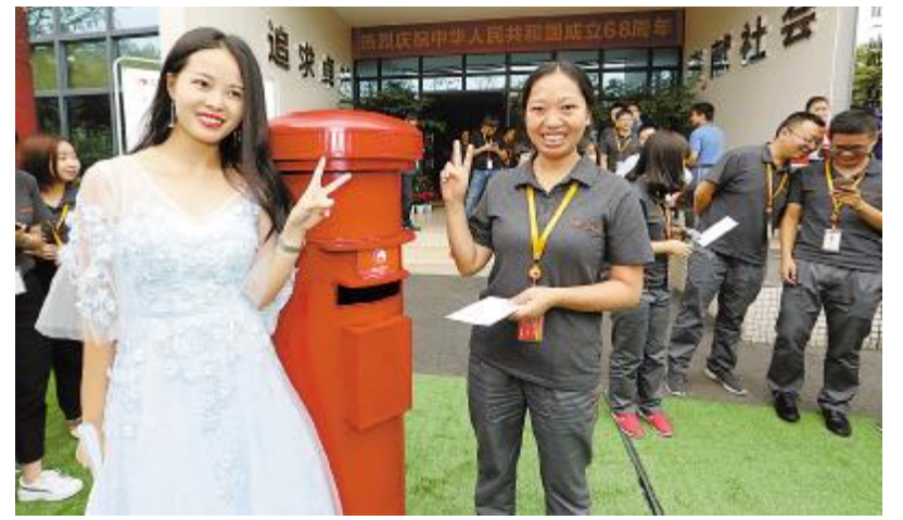
/ OPQ? @“信圆56”活动kl