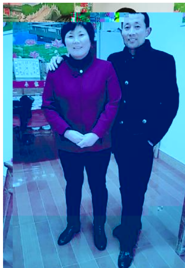
《 温馨而又甜蜜的字眼》 J KPO电池二=设备部时nj