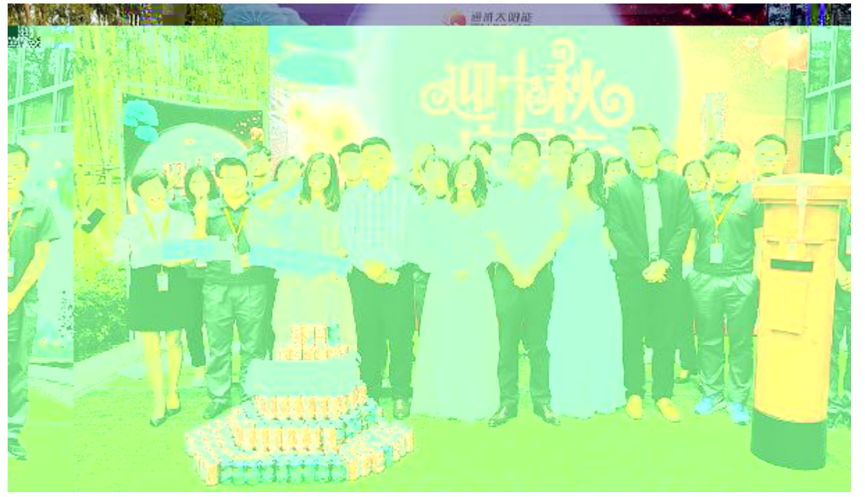
DEFGH“迎56·庆国庆”td活动klj影留念

通太阳能挥自,通过全力推进“”,将大千员工的责任命落实到精益生,通太阳能公司级清洁能公司提有力的精神动力。