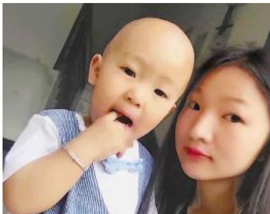
《我陪你 大,你陪我 变老》 /OPQ=> 部古玲