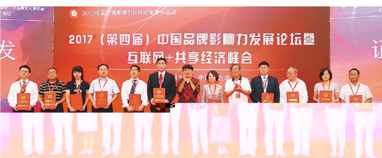
( ) * + , < = > ? @ A B C D E F G H

9: ; ! " % & ( ) * + , - . / ' 9 r 2 0 s , j k l m n ] 4 0 l o @ A O P p X h i 3 T ( _ t u v P , h i 2 3 B c k l \ ] } ~ • t x M 2 0 1 3 h i J 3 @ A 7 , h i 3 y $ n , _ < , T W \ ] s , h i 3 z ^ B e ; L 2 o g u ] e # , K z $ B J t