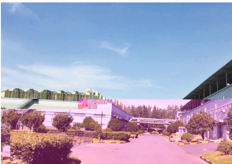
《《FF=>》 S• _` 厂务U陈保仑