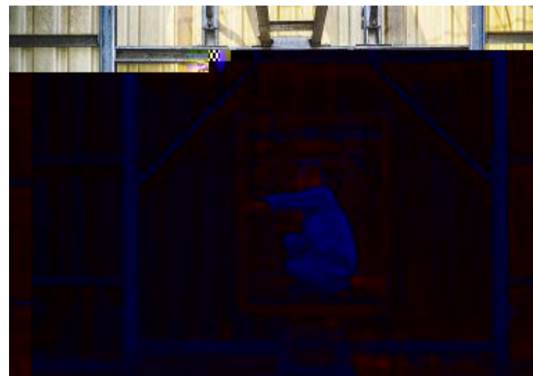
《 〇 [ ] Z[ _ ` 厂务U黄金贵